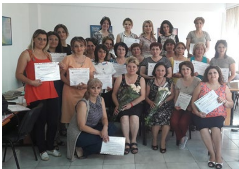
Photo de famille, Erevan, 30 juin 2017

« Organiser un cours de français langue étrangère au niveau A2 pour les classes de français renforcé à partir des manuels « PIXEL 3 et 4 » : tel est l'intitulé de la formation organisée à Erevan du 26 au 30 juin 2017 par le Centre régional francophone pour l'Europe centrale et orientale (CREFE-CO) de l'Organisation internationale de la Francophonie et l'Association arménienne des enseignants de français (AEEF), en partenariat avec le Ministère de l'Éducation d'Arménie et l'Alliance Française d'Arménie.