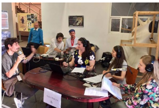
Emission en direct du village du Festival, Tulcea, juin 2017

Pour cette troisième année, cet atelier visait à familiariser les étudiants et les jeunes professionnels (de moins de 35 ans) francophones, en provenance d'Arménie, de Moldavie, de Serbie, de Roumanie et de Turquie, aux techniques de réalisation radiophonique sur la thématique de l'environnement.