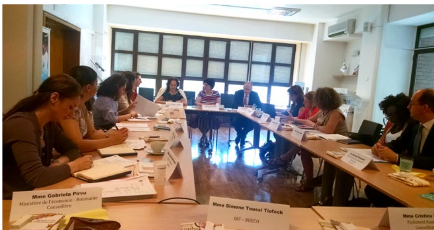
1ère réunion préparatoire pour la Conférence des Femmes de la Francophonie. BRECO-OIF, Bucarest, Juin 2017.

Le bureau régional de l'OIF pour l'Europe centrale et orientale (BRECO) a accueilli, du 21 au 23 juin 2017, la mission préparatoire en vue de l'organisation de la Conférence des femmes de la Francophonie qui se tiendra du 1er au 2 novembre à Bucarest sous le thème : « Création, innovation, entrepreneuriat, croissance et développement : les femmes s'imposent ! »