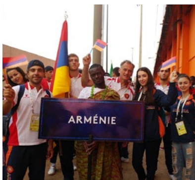
Abidjan 2017 : Délégation d'Arménie

La 8 ème édition des Jeux de la Francophonie s'est tenue à Abidjan du 21 au 30 juillet 2017, sous le signe de l'amitié, de la solidarité et de la fraternité. Quatre délégations d'Europe centrale et orientale y ont pris part.