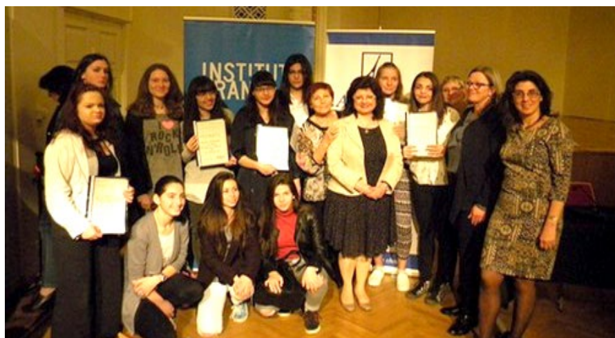
Lauréats du concours de traduction, avec les membres du jury, Sofia, mai 2017

La 34 ème édition du Concours national de traduction a été organisée à Sofia pour les élèves et étudiants Bulgares apprenant le français, l'espagnol et le grec. La cérémonie de remise des prix s'est déroulée le 22 mai 2017 à l'Institut français de Bulgarie à Sofia, en présence des représentants de chaque partenaire à l'organisation.