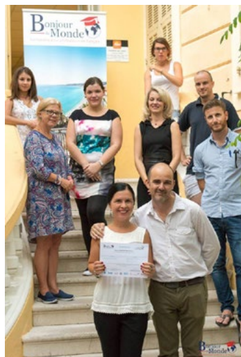
UDM Nice : Remise des attestations

En partenariat avec le CA-VILAM-Alliance française de Vichy et les Universités Bonjour du Monde, le CREFECO de l'OIF a fait bénéficier à 25 enseignants de l'Europe centrale et orientale de 2 formations délocalisées à Vichy et à Nice, respectivement, du 17 au 28 juillet 2017, et du 7 au 19 août 2017.