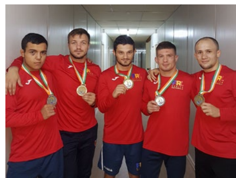
Abidjan 2017 : Médailleurs roumains en lutte libre masculine

Organisés tous les quatre ans, les Jeux de la Francophonie rassemblent, sous la bannière de l'amitié et de la fraternité, la communauté francophone des quatre coins du monde au sein d'un village multiculturel qui se meurt pendant 2 semaines, au rythme d'épreuves sportives et de concours culturels. La langue française, qui rassemble toute cette communauté, est le mode privilégié pour la communication, les échanges et le dialogue, au-delà des expressions artistiques.