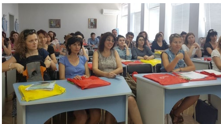
Université d'été, Varna (Bulgarie), juillet 2017

Cette formation visait le renforcement des capacités des professeurs de et en français de la région Europe centrale et orientale, de l'enseignement précoce à l'universitaire, en passant par le bilingue ou des pratiques de classe transversales. Elle a rassemblé une cinquantaine de participants venus d'Albanie, d'Arménie, de Bulgarie, de l'Ex-République yougoslave de Macédoine, de Moldavie et de Roumanie.