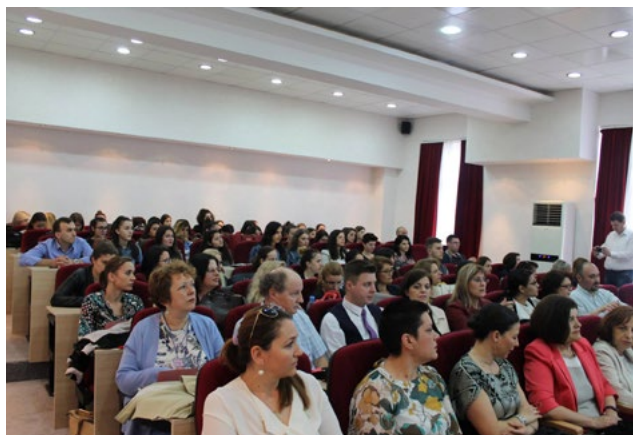
Conférence sur le français à l'université, Tirana, mai 2017

La faculté des langues étrangères de l'Université de Tirana a organisé, en partenariat avec l'agence universitaire de la Francophonie et l'Ambassade de France en Albanie, la conférence internationale sur le thème « Enseigner la / en langue française dans un contexte universitaire. Méthodologie et pratiques », le 26 mai 2017.