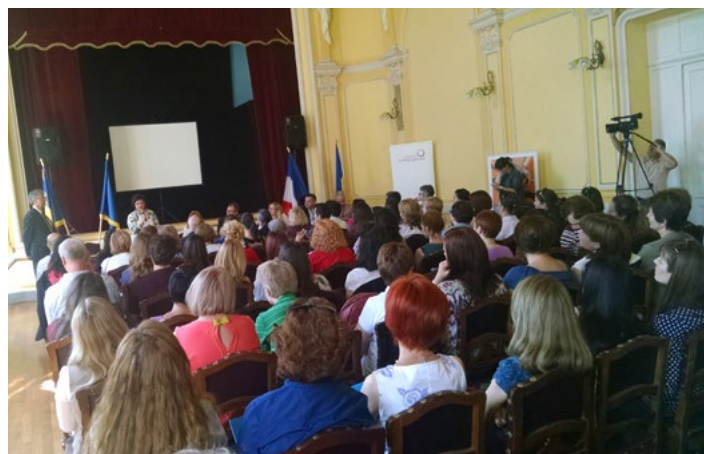
Stage BELC PECO, Cérémonie d'ouverture, Sibiu, juin 2017

L'université régionale - BELC, les métiers du français dans le monde s'est tenue dans la ville de Sibiu, (Roumanie), du 20 au 24 juin 2017. Cette première édition dans la région Europe centrale et orientale a été organisée par le Centre international d'études pédagogiques (CIEP) de Sèvres, en partenariat avec l'Institut Français de Roumanie, l'OIF par le biais du CREFECO, la Fédération internationale des professeurs de français (FIPF), l'Ambassade de France en Roumanie et TV5Monde.